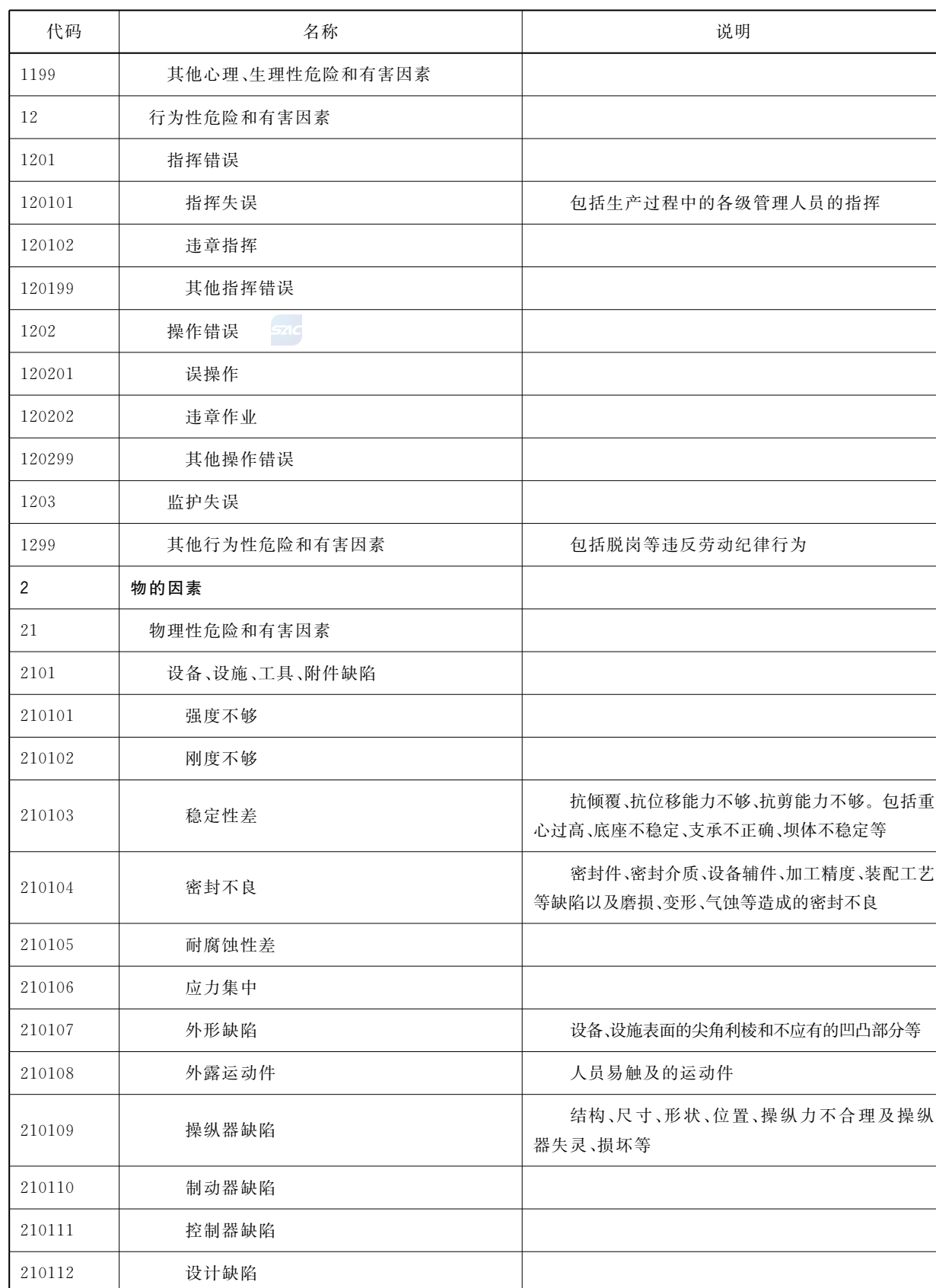
表 1 生产过程危险和有害因素分类与代码表（续）